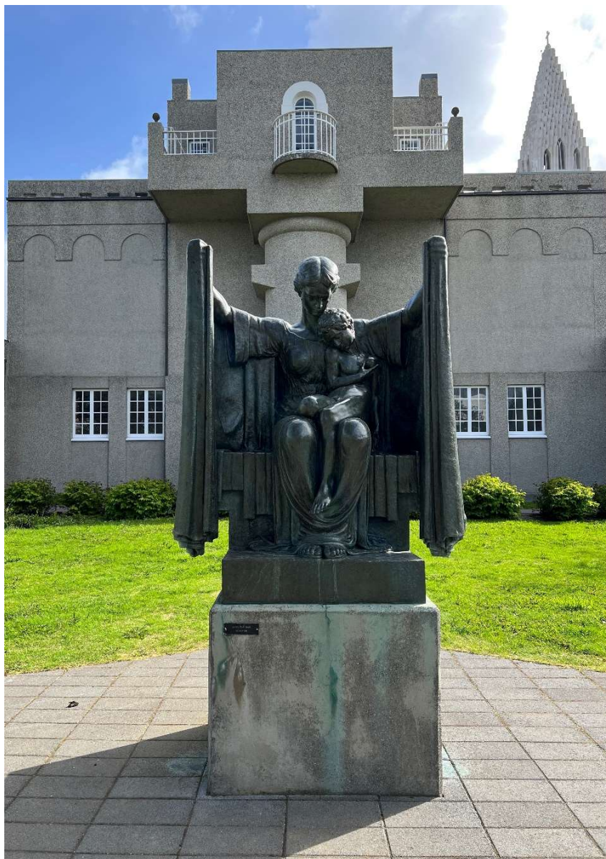
„Vernd“ e. Einar Jónsson.