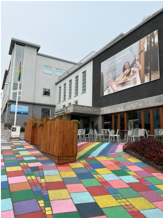
Fundur á Listasafni Akureyrar í ágúst.