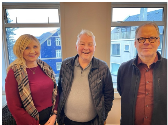
Undirritun safnasamnings við Listasafn HÍ