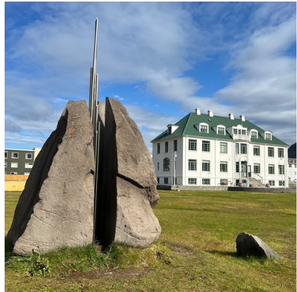
Fundur með Listasafni Ísafjarðar í september.