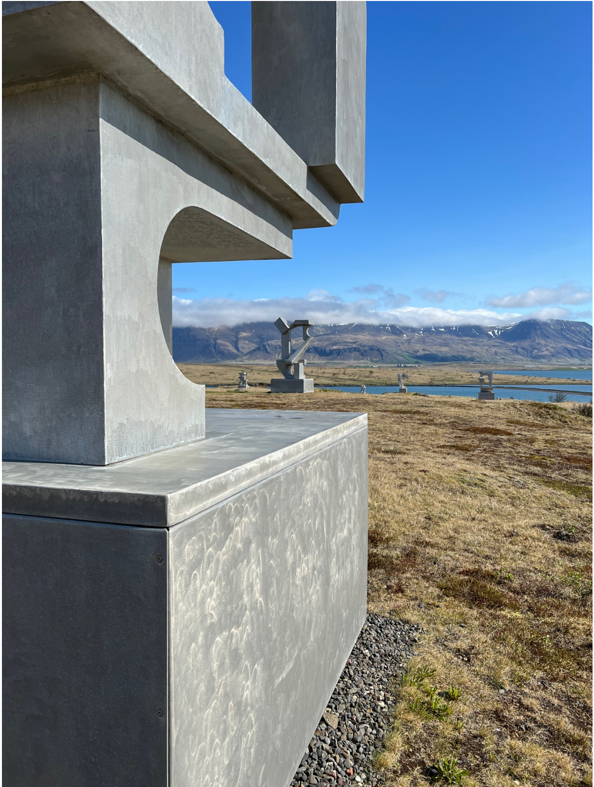
Skúlpúrar í Hallsteinsgarði e. Hallstein Sigurðsson.