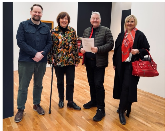
Undirritun safnasamnings við Listasafn Reykjavíkur